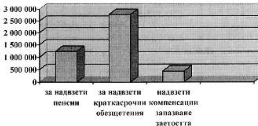
Вземания от главници, събирани от НОИ